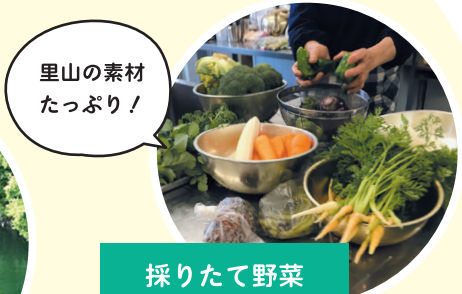
里山の素材 たっぷり！