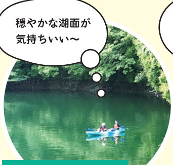
穏やかな湖面が 気持ちいい～