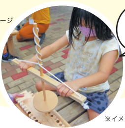
火起こし体験も あるよ！