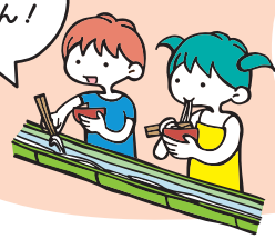
夏の風物詩！ 流しそうめん！